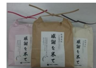
贈答用、ノベルティに活用