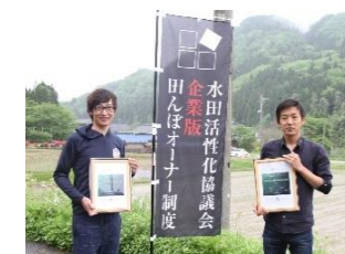
オーナー認定書発行